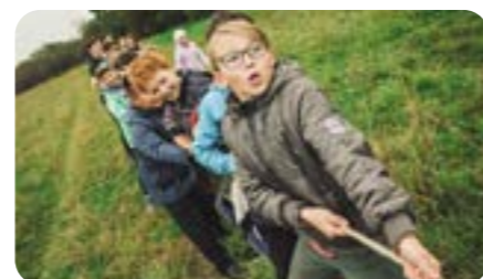
Veja como foi a live especial CoopCafé em comemoração ao Dia C 2021 e ao DIC. Página 16.