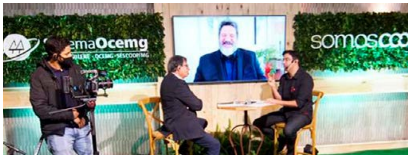
O filósofo e palestrante Mário Sérgio Cortella (no telão) foi uma das atrações da live do Dia C do Sistema Ocemg

O Sistema Ocemg realizou no dia 3 de julho, em uma transmissão ao vivo pelas multiplataformas da rádio 98 FM, o evento de celebração do Dia de Cooperar (Dia C) 2021. Na oportunidade, participaram presidentes e dirigentes de cooperativas, representantes de entidades beneficiadas pelas ações, além do renomado filósofo e palestrante Mário Sérgio Cortella, que falou sobre cooperativismo e ética nos tempos atuais.