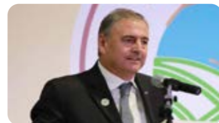
Mensagem do presidente da ACI pelo Dia Internacional das Cooperativas. Página 5.