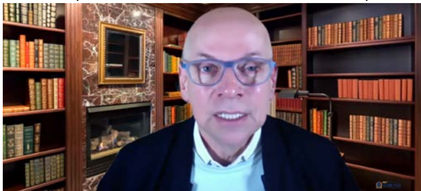
O filósofo e historiador Leandro Karnal encerra a Semana do Cooperativismo Catarinense

Em comemoração ao Dia Internacional do Cooperativismo, o Sistema Ocesc promoveu a Semana do Cooperativismo Catarinense, de 28 de junho a 2 de julho de 2021. O evento inédito para o setor no Estado foi uma realização da Organização das Cooperativas do Estado de Santa Catarina (Ocesc) e do Serviço Nacional de Aprendizagem do Cooperativismo do Estado de Santa Catarina (Sescoop/SC).