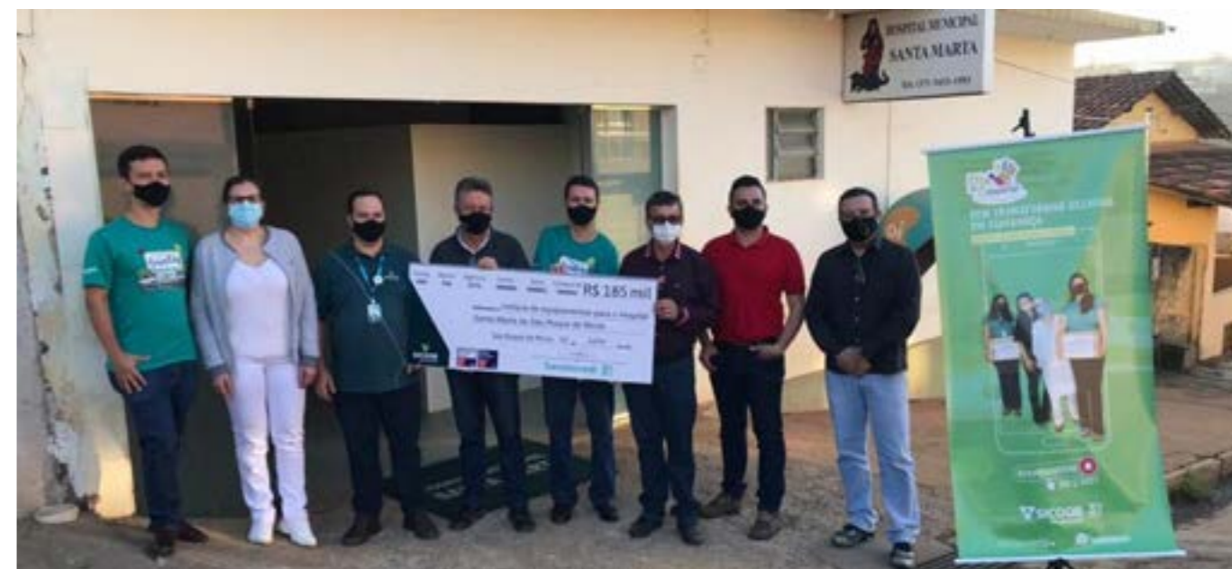
Entrega do cheque simbólico do Sicoob Saramcredi ao Hospital Santa Marta de São Roque de Minas

A iniciativa faz parte do Dia de Cooperar (Dia C) 2021 da cooperativa, que promoveu ainda a doação de kits de higiene pessoal e cestas básicas para o Conselho Tutelar de Vargem Bonita, que fará a entrega para famílias carentes da cidade.