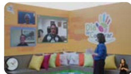
Coops de todo o Brasil celebram o Dia de Cooperar 2021. Página 10.