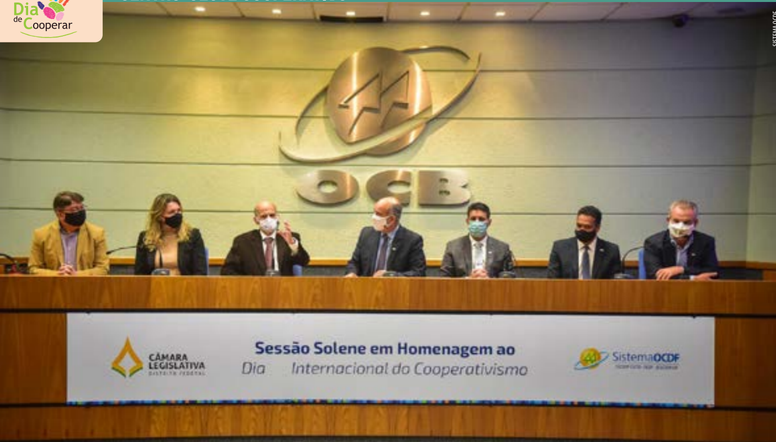
A solenidade em homenagem ao Dia Internacional do Cooperativismo promovida pelo Sistema OCDF aconteceu na sede da OCB