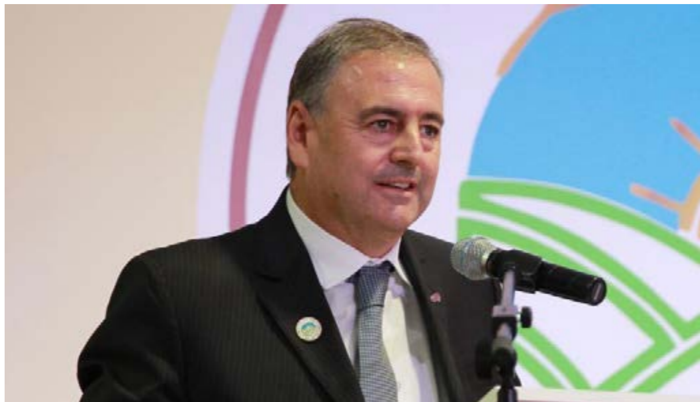
Ariel Guarco, presidente da Aliança Cooperativa Internacional