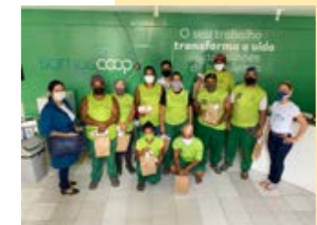
Ações do Dia C em Alagoas aconteceram em todo o estado