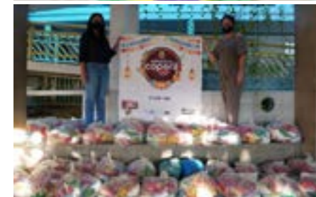
Cenas de ações do Dia de Cooperar no cooperativismo baiano